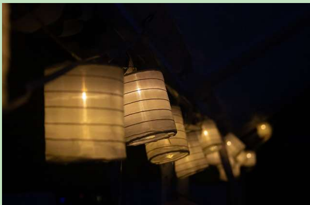
Auch wenn es hübsch aussieht: Solarlichter im Freien sind wenig naturfreundlich.

! Leuchtmittel mit wenig UV-Anteil einsetzen (LED warm white unter 3'000 K).