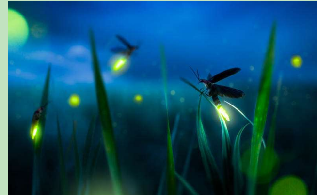
Glühwürmchen sind selten geworden: Um sich fortpflanzen zu können, sind sie auf die tiefe Dunkelheit der Nacht angewiesen.