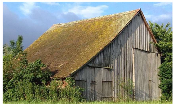
Alte Scheunen und Dachstöcke dienen den herzigen Säugern als Winterquartier aber auch als Kinderstube.