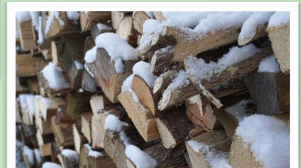
Hier finden Fledermäuse Schutz vor der Kälte.