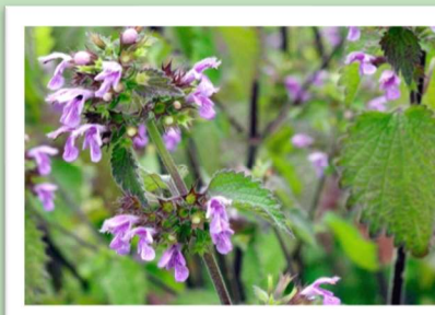
Pflanzen wie die Schwarznessel locken Nachtfalter an.