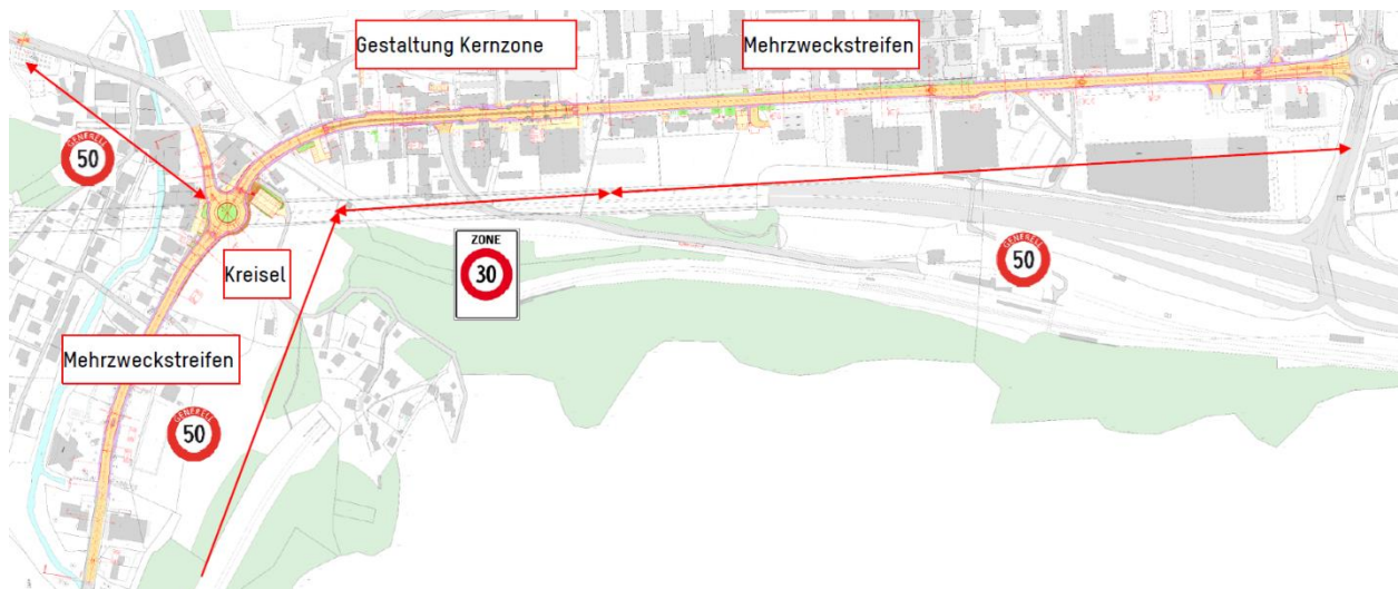
Abbildung 1: Projektperimeter und Geschwindigkeitsregime